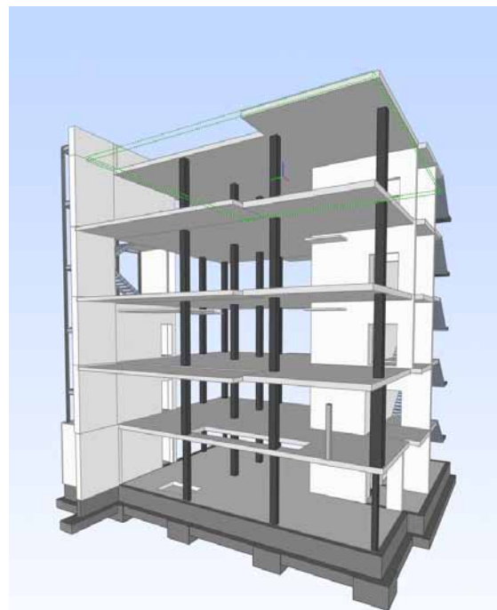
Die vollautomatische Schalungssoftware PPL 11.0 liest über die integrierte IFC-Schnittstelle die BIM-Daten ein und generiert daraus die optimale Schalungskomplettplanung.