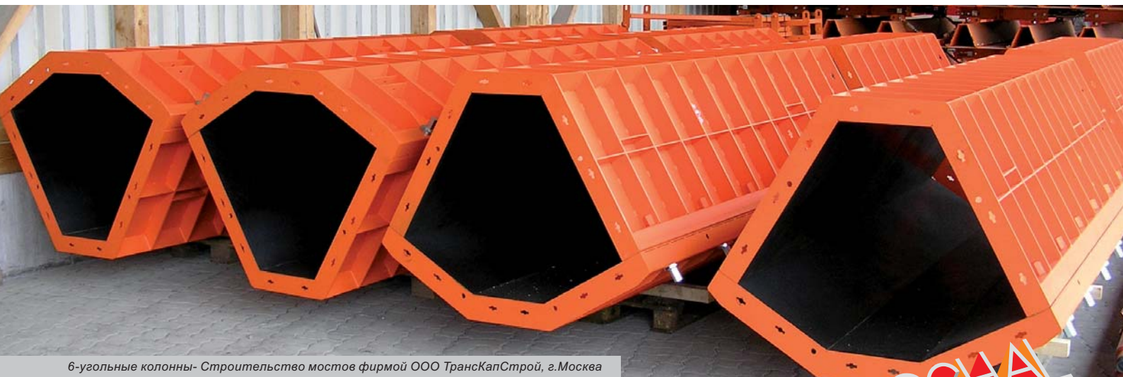
6-угольные колонны- Строительство мостов фирмой ООО ТрансКапСтрой, г.Москва