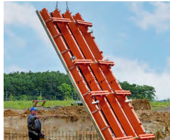
Les brides de serrage sont « rangées » sur la banche lors du décoffrage et sont immédiatement à portée de main lors de la prochaine utilisation.

Des décalages en hauteur en continu sont possibles entre les différentes banches, ce qui permet d'adapter parfaitement le coffrage à un sol incliné.