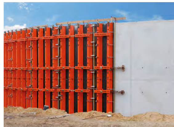
Le système de coffrage circulaire avec technique de liaison par brides de serrage séduit sur le chantier.