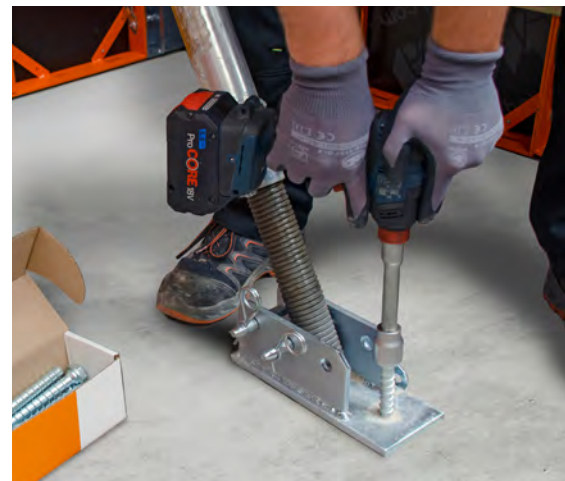
Die Montageschraube lässt sich problemlos in die Betonfläche schrauben.