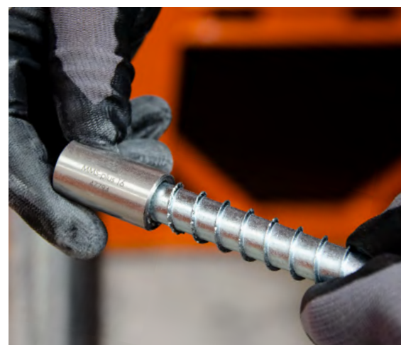
Mit der inkludierten Prüfhülse kann die Montageschraube bei temporären Befestigungen jederzeit auf Wiederverwendbarkeit geprüft werden.