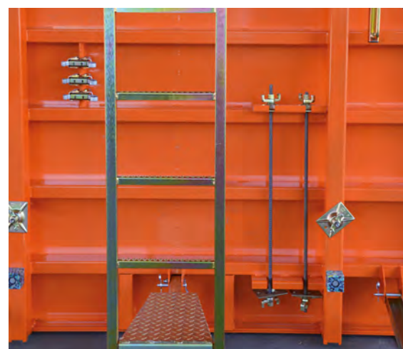
Durchdacht bis ins Detail: Für eine aufgeräumte Baustelle ohne Materialverlust.