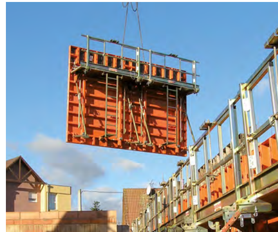
Die Krananhängung ist fester Bestandteil jedes Schalelementes des Systems LOGO.S.

Die langlebige Stahlschalhaut wird von der Rahmenseite her bündig verschweißt, sodass weder Schraub-/Nietabdrücke noch Rahmenabdrücke im Beton verbleiben und hervorragende Sichtbetonergebnisse erzielt werden.