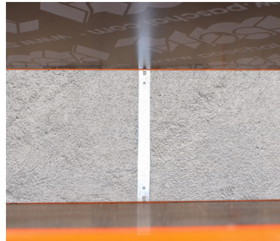
Der LOGO-Fundamentspanner ist der perfekte Anker, um ein Fundament kostengünstig zu schalen.

12/15/17,5/20/24/25/30/35/35/36,5/40/45/50/60/70/80/90/100 cm (weitere Maße auf Anfrage)