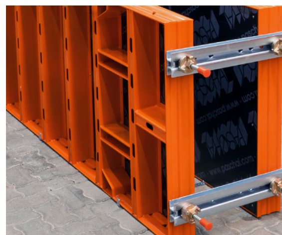
Die verfügbaren Schalungselemente können durch den Fundamentspanner im liegenden Einsatz verwendet werden.