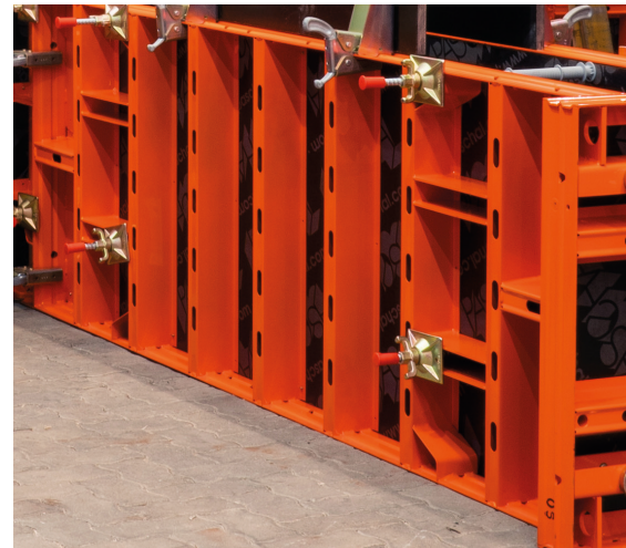
Quatre trous pour tiges à l'intérieur et à l'extérieur permettent une utilisation polyvalente.

Tous les trous pour tiges - extérieurs et intérieurs - sont symétriques.