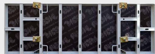
L'élément est disponible en version acier et en version aluminium.