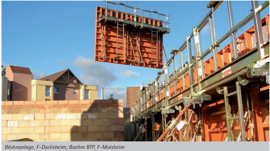
Wohnanlage, F-Dorlisheim; Boehm BTP, F-Molsheim