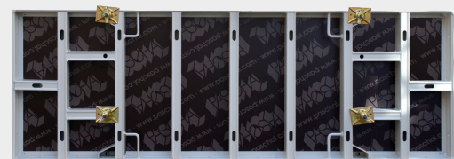
Das Element ist sowohl in der Stahl- als auch in der Aluminiumvariante verfügbar.